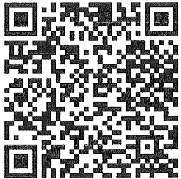
QR Code เอกสารประกาศเผยแพร่

ส่วนราชการ โรงพยาบาลสมเด็จพระยุพราชสระแก้ว (กลุ่มงานพัฒนาระบบงาน) ที่ สก. ๑๓๓๒.๒๕๖๓ / ๐๒๖ เรื่อง การส่งเสริมคุณธรรมและความโปร่งใสในการดำเนินงานของหน่วยงานภาครัฐ : ด้านความพร้อมรับผิด (กระบวนการประเมินผลการปฏิบัติราชการ) วันที่ ๑๙ เมษายน ๒๕๖๔ บันทึกข้อความ ด้วย โรงพยาบาลสมเด็จพระยุพราชสระแก้ว เป็นหน่วยงานที่เข้าร่วมการประเมินคุณธรรมและความโปร่งใสในการดำเนินงานของหน่วยงานภาครัฐ (Integrity and Transparency Assessment) เป็นงานของหน่วยงานภาครัฐ ซึ่งการประเมินคุณธรรมและความโปร่งใสในการดำเนินงานของหน่วยงานภาครัฐเป็นสิ่งสำคัญที่สะท้อนถึงคุณลักษณะที่ดีในหน่วยงานได้ และเป็นประโยชน์ต่อการพัฒนาหน่วยงานให้มีความโปร่งใสและมีความรับผิดชอบต่อสังคม การประเมินคุณธรรมและความโปร่งใสในการดำเนินงานของหน่วยงานภาครัฐ (Integrity and Transparency Assessment) เป็นงานของหน่วยงานภาครัฐ ซึ่งการประเมินคุณธรรมและความโปร่งใสในการดำเนินงานของหน่วยงานภาครัฐเป็นสิ่งสำคัญที่สะท้อนถึงคุณลักษณะที่ดีในหน่วยงานได้ และเป็นประโยชน์ต่อการพัฒนาหน่วยงานให้มีความโปร่งใสและมีความรับผิดชอบต่อสังคม การประเมินคุณธรรมและความโปร่งใสในการดำเนินงานของหน่วยงานภาครัฐ (Integrity and Transparency Assessment) เป็นงานของหน่วยงานภาครัฐ ซึ่งการประเมินคุณธรรมและความโปร่งใสในการดำเนินงานของหน่วยงานภาครัฐเป็นสิ่งสำคัญที่สะท้อนถึงคุณลักษณะที่ดีในหน่วยงานได้ และเป็นประโยชน์ต่อการพัฒนาหน่วยงานให้มีความโปร่งใสและมีความรับผิดชอบต่อสังคม